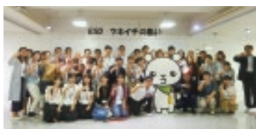
市民交流会の開催(ESDステーション)