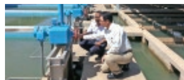
カンボジアでの技術協力