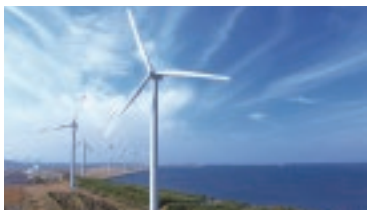
風力発電等の環境・エネルギー関連産業の集積